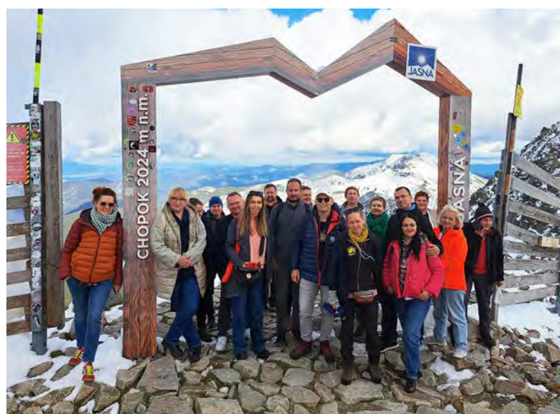
Poľskí touroperátori počas infocesty regiónmi Žilinského kraja navštívili tiež jeden z najnavštevovanejších vrcholov Nízkych Tatier – Chopok