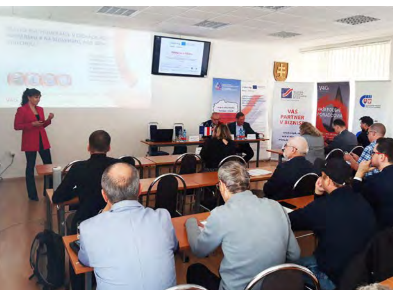
O seminár „Podnikaj v Poľsku“ bol zo strany podnikateľov veľký záujem vzhľadom na rastúci trend poľského trhu