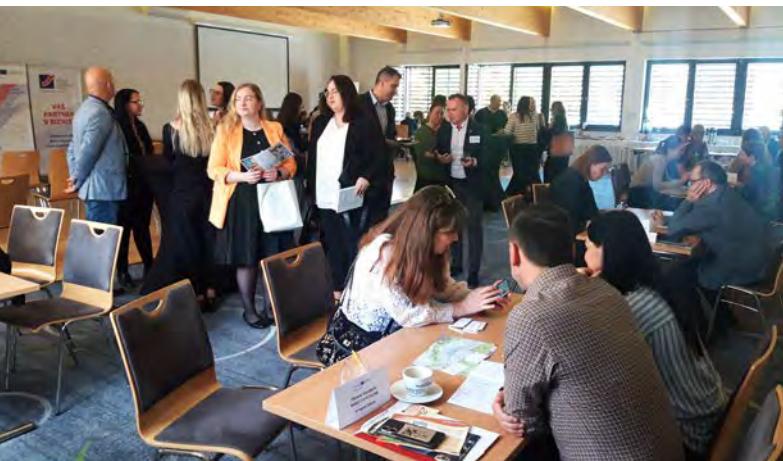
B2B rokovania slovenských subjektov cestovného ruchu s poľskými touroperátormi počas workshopu cestovného ruchu