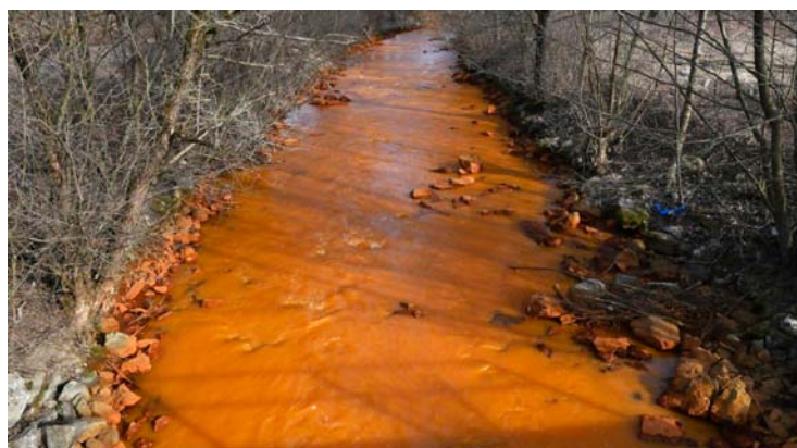
Znečistený tok rieky Slaná

Projekt REMEDY, s celkovým rozpočtom tri milióny eur, odštartoval v júli 2024 a jeho realizácia je plánovaná na dva roky. Tento ambiciózny projekt predstavuje významný krok v riešení environmentálnych výziev Slovenska a ponúka inovatívne riešenia, ktoré môžu slúžiť ako model pre ďalšie krajiny. sav ●